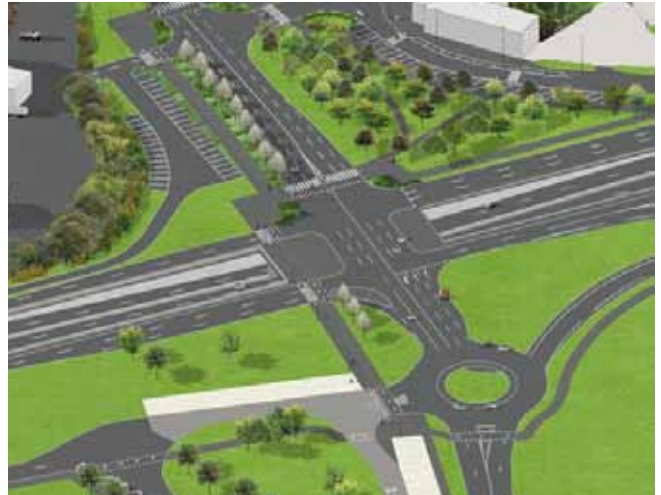
Christ de Saclay © Outside architectes paysagistes (Orsay)

Lettre infochantiers : www.infochantiers.u-psud.fr Carte interactive des chantiers : http://carte.epaps.fr Actualités des chantiers : www.bit.ly/actualites-chantiers Echanges et discussions : www.epaps.fr/echange/