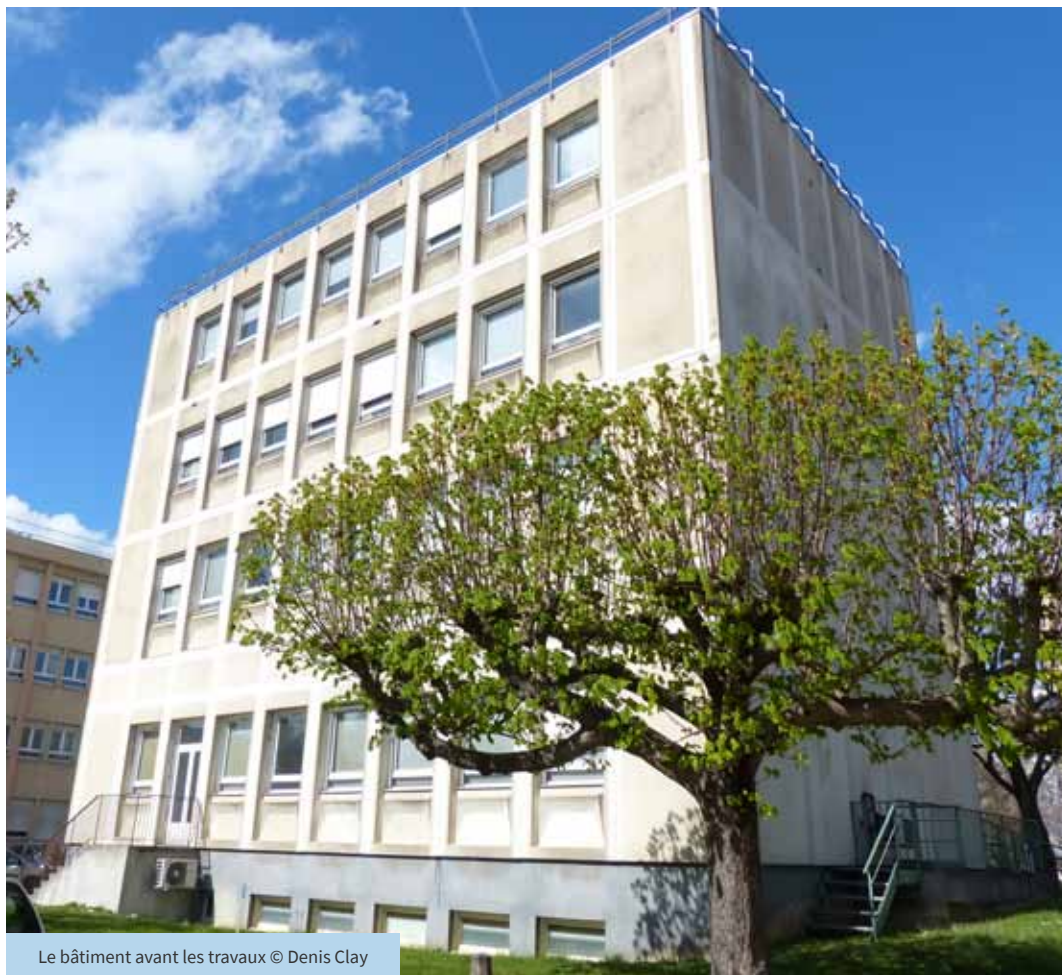
Le bâtiment avant les travaux