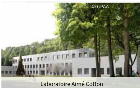
Laboratoire Aimé Cotton