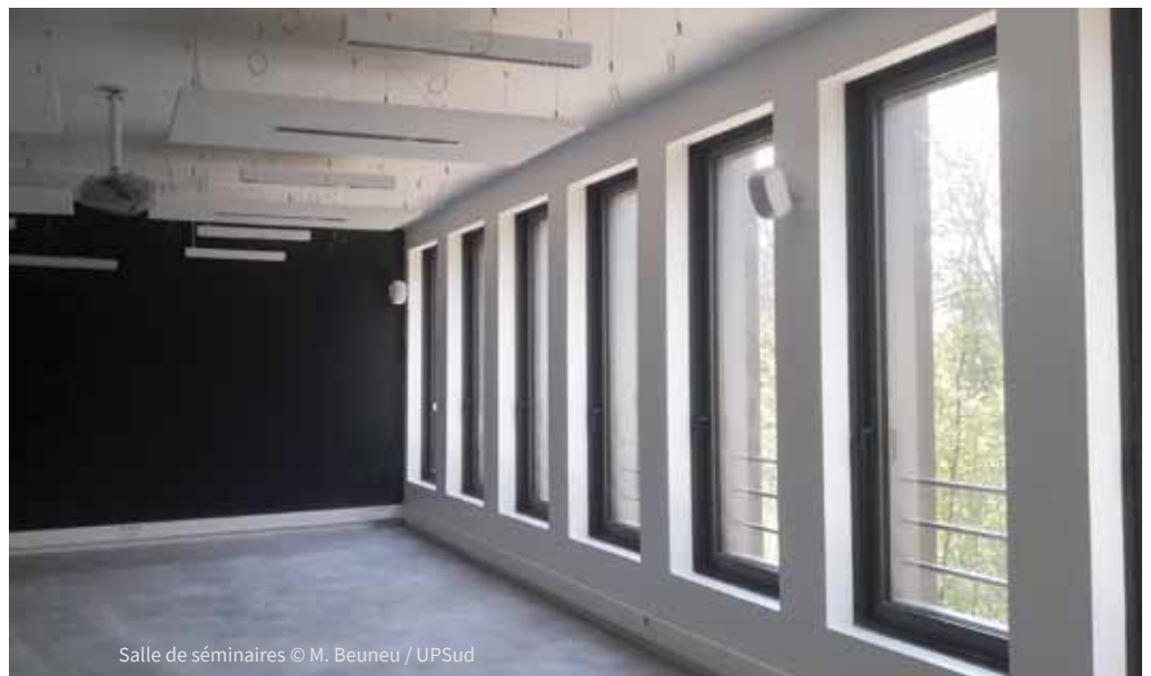
Salle de séminaires

L'emménagement va nous permettre de rassembler l'équipe de l'Institut Pascal. Depuis le lancement du projet, fonctionner « hors les murs », comme par exemple au bâtiment 209F ou à l'IPhT, s'est avéré très compliqué sur le plan de l'organisation des événements. Au sein du bâtiment Pascal, nous serons réunis et nous disposerons des locaux et de