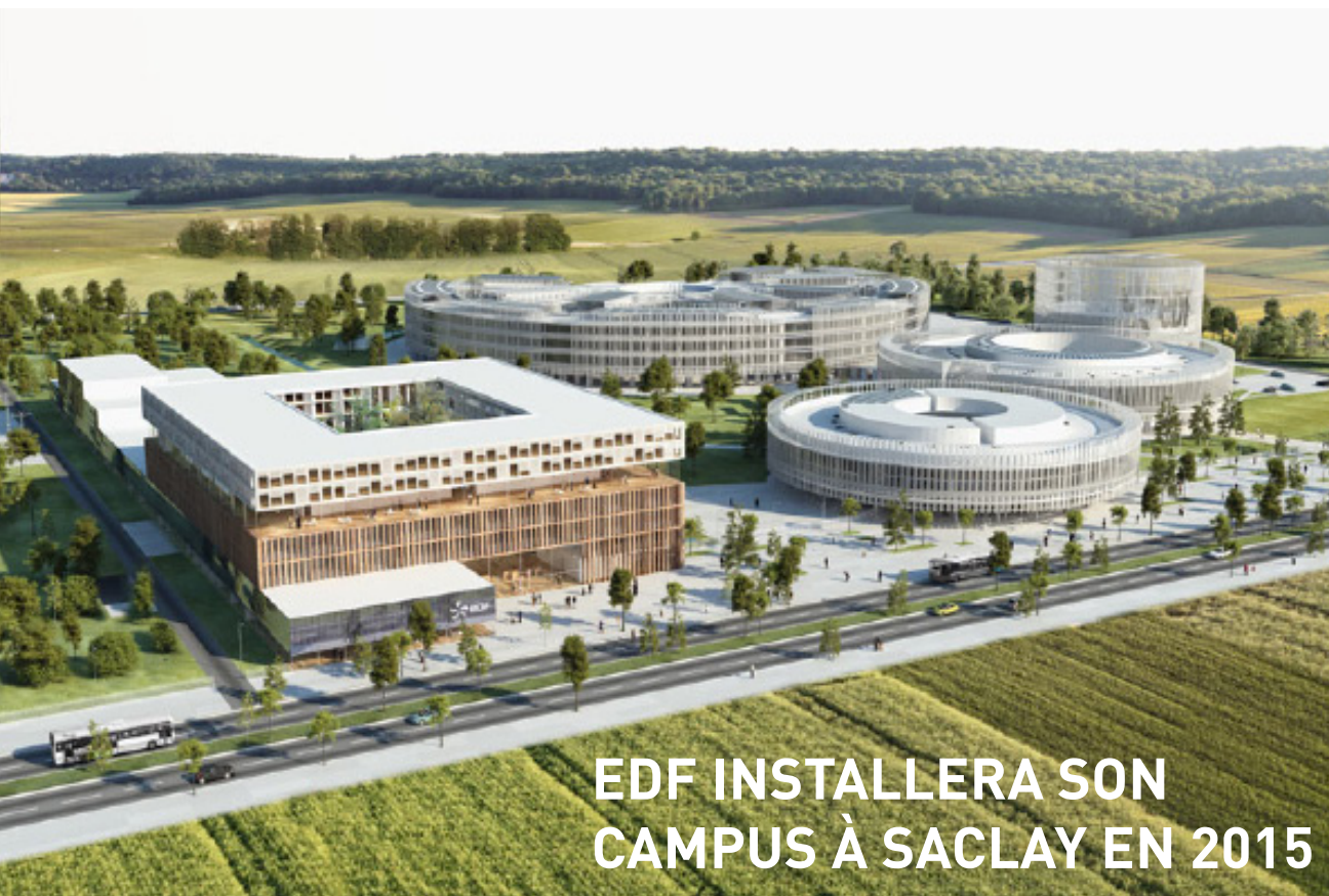
Vue du futur campus EDF de Saclay desservi par le transport en commun en site propre (bâtiment de gauche), et en arrière-plan à droite le centre de recherche & développement du groupe.