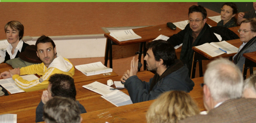
Réunion de restitution de l'enquête d'usage et vie de campus en 2010

« Un grand travail de réflexion est en cours, et doit être poursuivi au sein de l'université pour décider de son avenir et de sa place dans le projet d'Université Paris-Saclay, avec l'ensemble de la communauté »