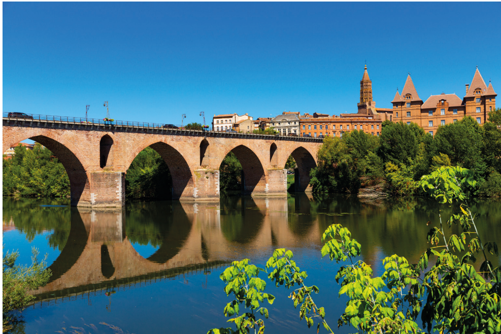
Montauban pont et rivière Tarn (Département de Tarn-et-Garonne)

Par son arrêt d'Assemblée du 4 avril 2014, Département de Tarn-et-Garonne , le Conseil d'État a ouvert le recours direct contre les contrats administratifs aux tiers susceptibles d'être lésés, dans leurs intérêts, par leur passation ou par leurs clauses. Cette décision poursuit une finalité assumée de simplification du contentieux contractuel, notamment car elle entend unifier, autour du seul juge du contrat, l'ensemble des recours dirigés contre les contrats administratifs. Cette demi-journée est ainsi l'occasion d'apprécier si cet objectif de simplification peut, ou non, être considéré comme atteint après dix ans d'application de la jurisprudence Département de Tarn-et-Garonne .