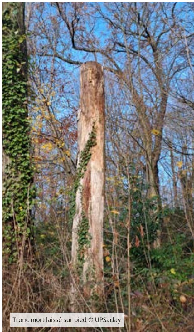
Tronc mort laissé sur pied

▶▶▶ Quand ils ne servent pas directement, déchets de coupe et feuilles sont valorisés en broyat pour le paillage des massifs et pied d'arbres ou bien en terreau de feuilles utiles aux nouvelles plantations. Les équipes transforment par ailleurs ces ressources en bois pour du mobilier urbain (banc, tables...).