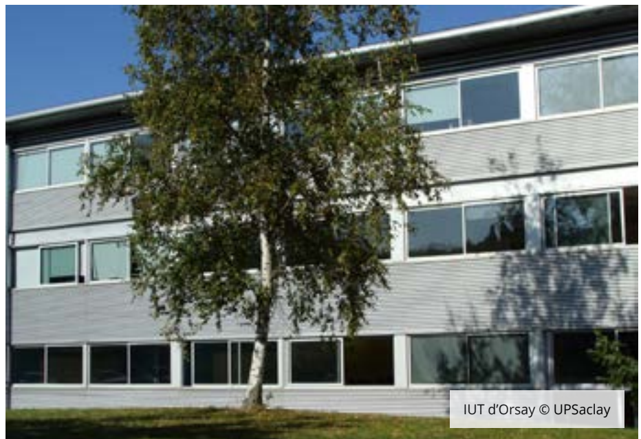
IUT d'Orsay