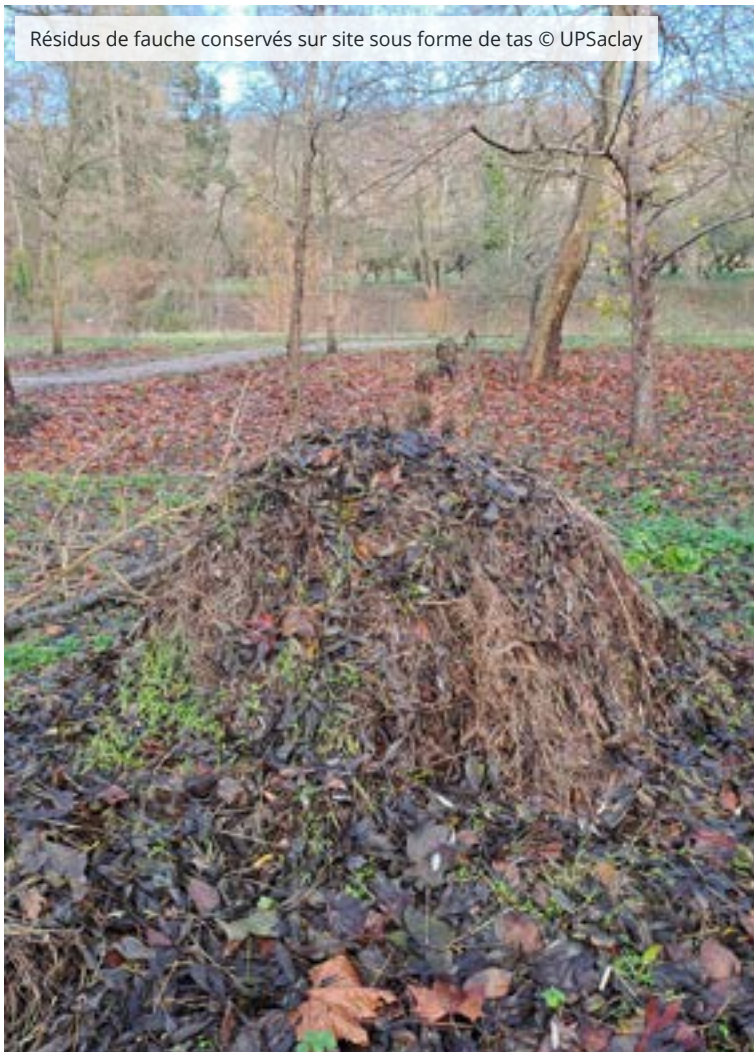
Résidus de fauche conservés sur site sous forme de tas