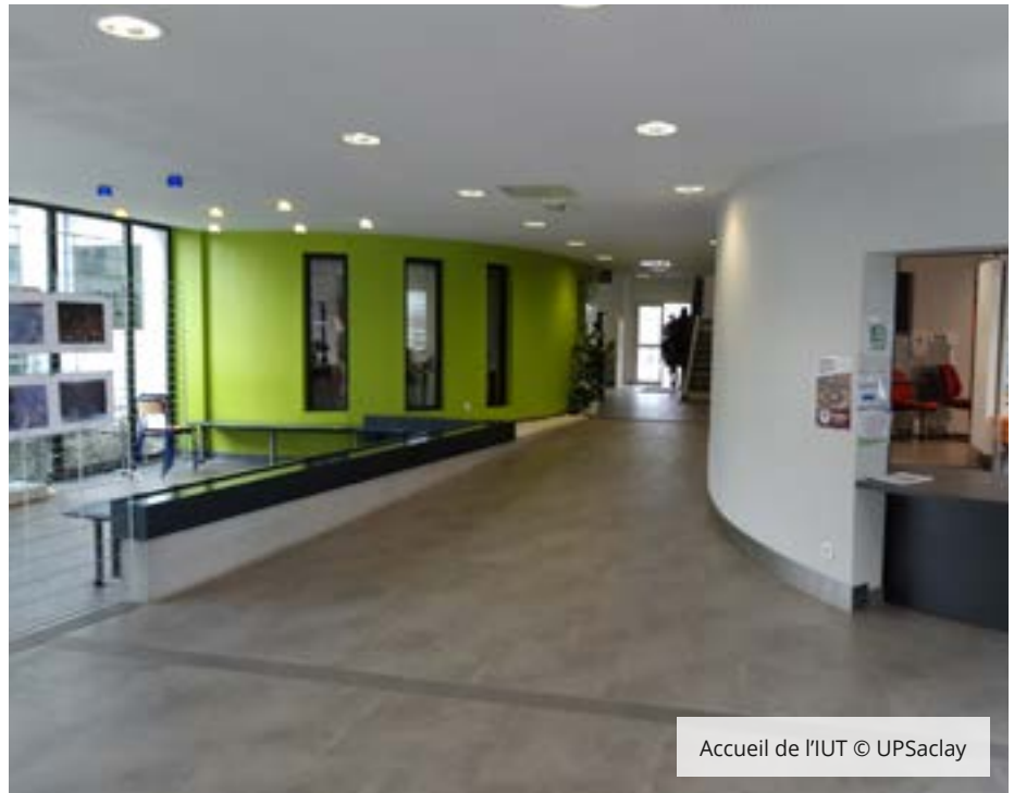
Accueil de l'IUT