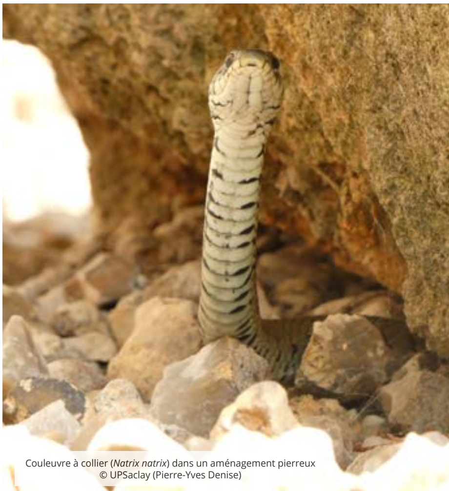
Couleuvre à collier ( Natrix natrix ) dans un aménagement pierreux

Prochainement, une haie de Benjes – autrement appelée haie sèche ou morte, sera créée au niveau du bosquet andin (à l'arrière du bât. 360). Ce type de conception, mise au point par le paysagiste et écologiste allemand Hermann Benjes dans les années 1980, consiste en un aménagement vertical (piquets de bois) qui sert de réceptacle aux résidus de tailles (branches d'arbres et arbustes), de ramassage des feuilles et de désherbage (herbacées, racines) accumulés au fil du temps. Cette haie écologique viendra remplacer l'actuelle protection installée chaque année pour protéger les espèces végétales andines sensibles aux vents hivernaux. Surtout, se végétalisant au gré d'un ensemencement naturel, elle offrira un abri à la faune avicole et aux petits mammifères. ▶▶▶