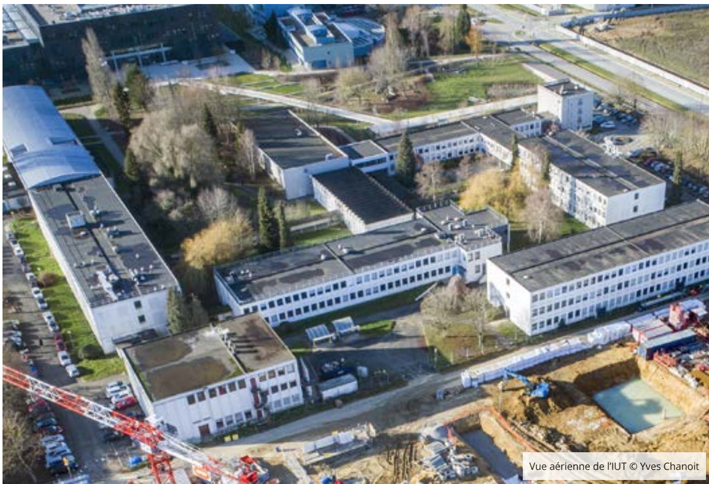
Vue aérienne de l'IUT

Officiellement créé le 20 mars 1970, l'IUT d'Orsay est parmi les premières entités à s'installer sur le plateau de Moulon. Aujourd'hui, il est voisin du site Henri Moissan, de CentraleSupélec, de l'IPSS et de la future gare Orsay – Gif de la ligne 18 du Grand Paris Express. L'IUT d'Orsay accueille 1 200 étudiants et 150 enseignants, répartis en 3 départements : Informatique, Mesures Physiques et Chimie.