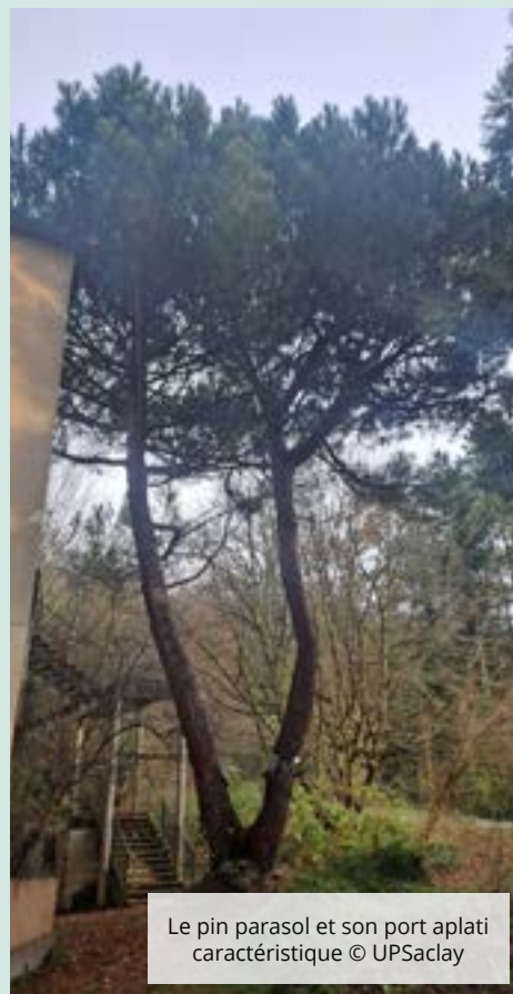
Le pin parasol et son port aplati caractéristique

Les cônes femelles fécondés - appelés pignes -, après maturation de trois ans, libèrent de leurs écailles de grosses graines noirâtres contenant une amande comestible donnant son nom au pin pignon. Consommée au moins depuis l'Antiquité, cette amande représente une excellente source de protéines et de lipides appréciée notamment des écureuils. Le bois du Pinus pinea , à la fois souple et léger, sert en menuiserie et en charpenterie. Son écorce grisâtre se desquame en larges plaques laissant apparaître un brun orangé remarquable. Apprécié pour ses qualités paysagères, il est également utilisé dans la lutte contre l'érosion pour la fixation des dunes côtières.