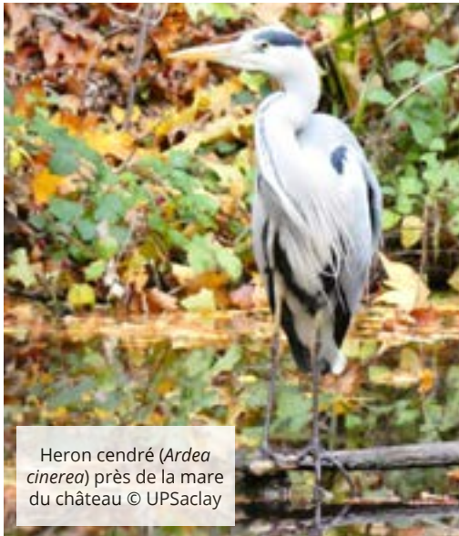
Heron cendré ( Ardea cinerea ) près de la mare du château

Chaque année, le Jardin botanique, situé sur les campus plateau et vallée de Gif-sur-Yvette, Bures-sur-Yvette et Orsay, propose un programme riche en animations afin de découvrir ses collections végétales.