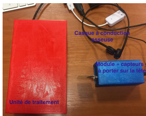
Figure 1: Le prototype

Notre capacité à localiser une source sonore est liée à la différence de signal reçu par chaque oreille qui est interprétée par le cerveau. Il est possible de mesurer ou de simuler les fonctions transfert (appelées : Head Related Transfert Fonction - HRTF) qui caractérisent la façon dont les oreilles reçoivent un son d'un point dans l'espace. Ces fonctions de transferts peuvent ensuite être utilisées pour synthétiser un son spatialisé par convolution. Écoulé au casque, l'auditeur aura alors l'illusion que le son provient d'une direction spécifique. Cette capacité de localisation, permet aux personnes aveugles de suivre des personnes, simplement en entendant de bruit de leurs pas. De la même façon, nous cherchons à guider quelqu'un avec un son spatialisé généré en temps réel et écouté avec un simple casque. Le moteur de rendu sonore 3D temps réel développé par l'équipe est capable de fonctionner sur un système portable, embarqué et autonome (Visible figure 1).